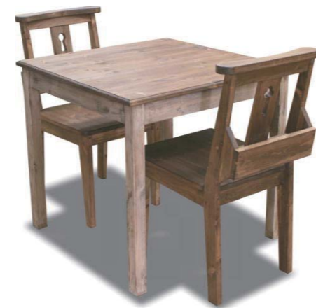
ダイニングテーブル