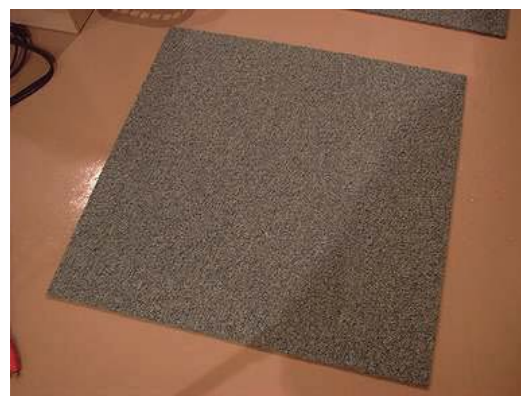
居間 寝室 床 タイルカーペット