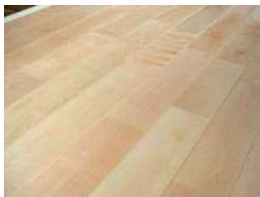
ダイニング 床 フローリング