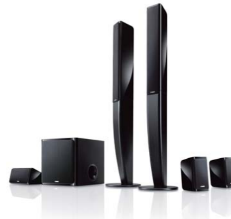
スピーカー YAMAHA NS-PA40