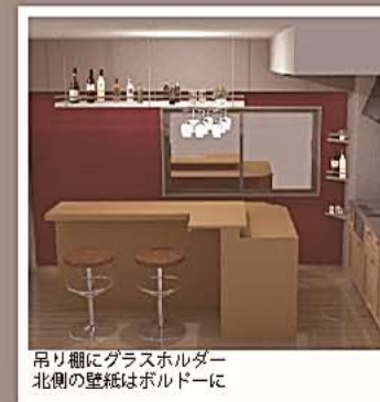
吊り棚にグラスホルダー 北側の壁紙はボルドーに