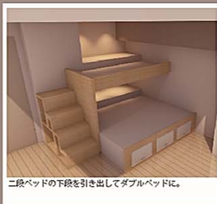
二段ベッドの下端を引き出してダブルベッドに。