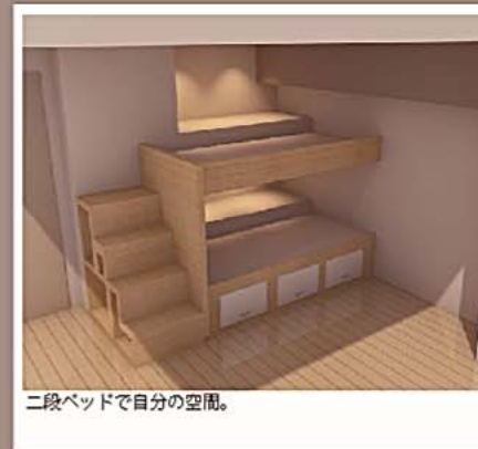
二段ベッドで自分の空間。