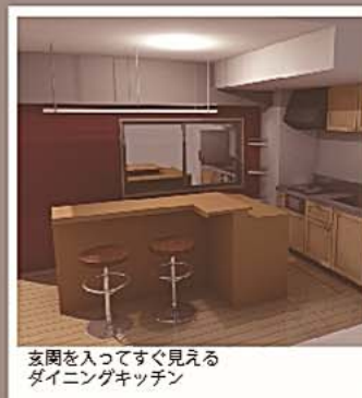
玄関を入ってすぐ見える ダイニングキッチン