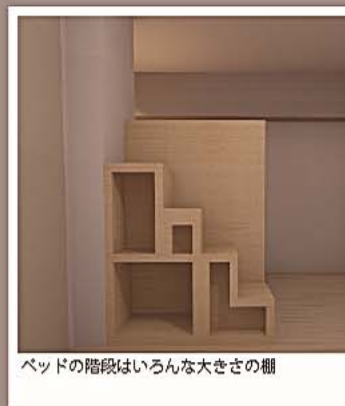
ベッドの階段はいろんな大きさの棚