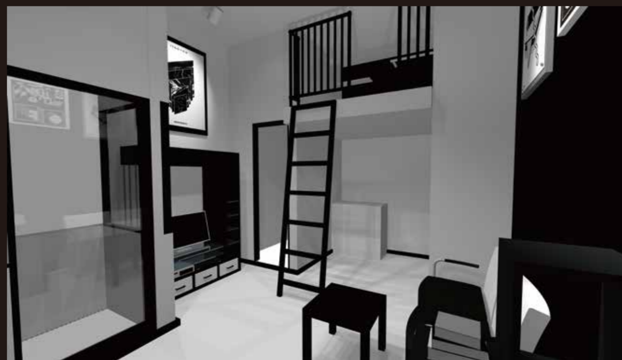
デスク側から見たパース