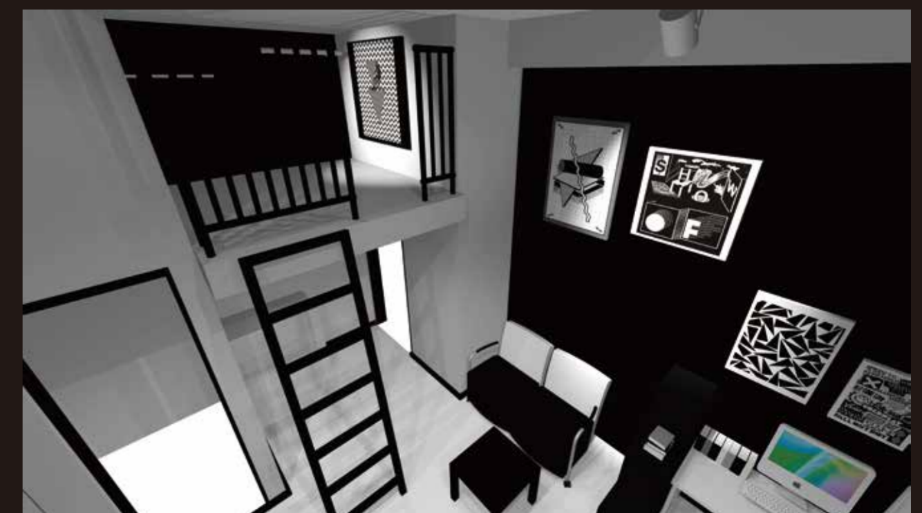
ロフト側を見たパース