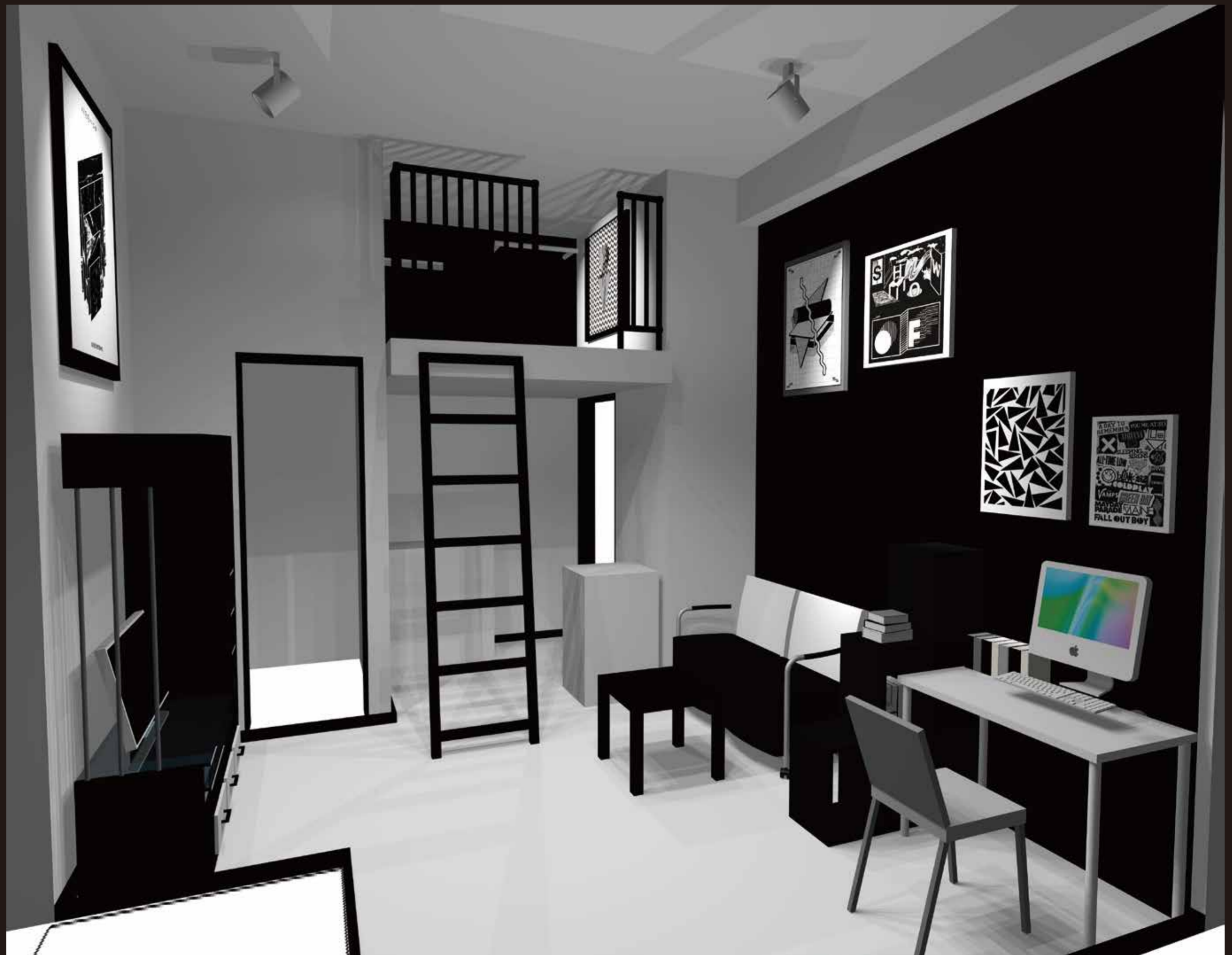
窓側から見たパース

ファッションだけでなく、住む部屋だってカッコよく。 二面の壁は黒にし、部屋全体に絞まりを出しました。 全体の照明はダウンライトに、壁面3ヶ所にはスポットライトを設置しているので 自分好みの絵を飾ったりレイアウトの楽しみが増します。