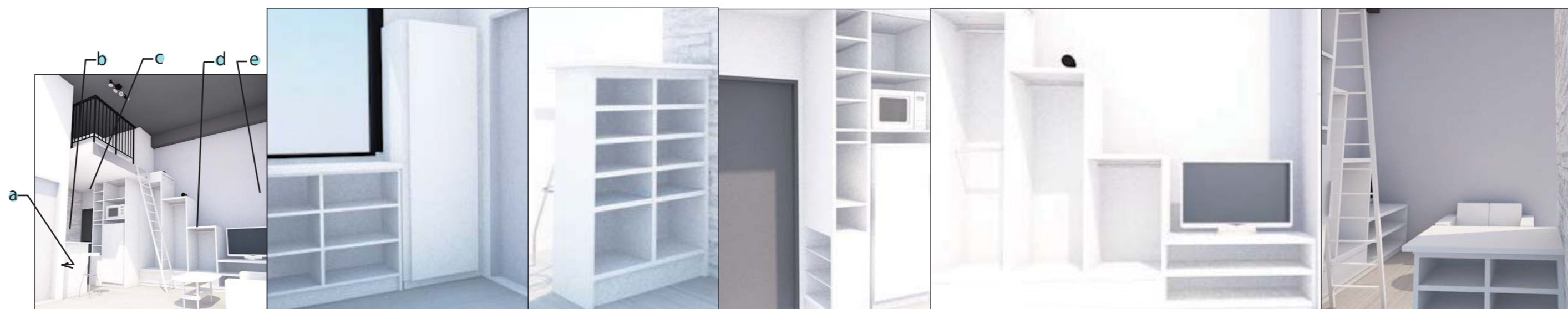
a: 扉付きには掃除用具を収納 タオル等はオープン棚に。 b: カウンター裏 食器やお酒等。 c: 入口には靴を、反対側 にはキッチン用品を。 d: 服は魅せる収納でインテリアの一部に。 e: ソファ側の壁一面は黒板塗料。 段差を付けて圧迫感を低減。座ることも！ センス良く彩ってみては？