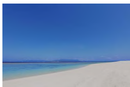
壁仕上げ：自然風景クロス

壁を浜辺の自然風景のクロスで仕上げ、白木の造作を立体的に取り付けることで浜辺のコテージにいるような感覚に。遊び盛りの学生には更なる遊びを日々仕事に追われる社会人にはせわしない毎日に潤いを、夢の無いフリーターには、いつかはばたく時のために必要な充電期間を与えてくれる空間演出。