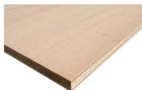
造作下地：ランバーコア合板